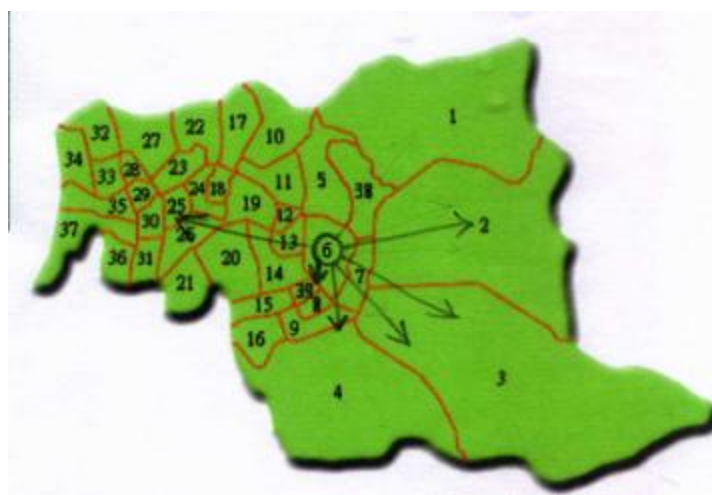
圖 5 文山產業發展路徑分布圖（註 20）

展路徑串結的主軸。另外，多年來不間斷的環境保護工作，已型構多元廚餘回收再開發典例，包括社區型、家庭型、學校型、福利型與企業型等分散在文山不同角落，當串結這些發展節點時，「廚餘環保之旅」的教學、休閒與生活功能成爲社區治理焦點。且將這些路徑分布如圖 5 所示，產業路徑規劃整合如圖 6。