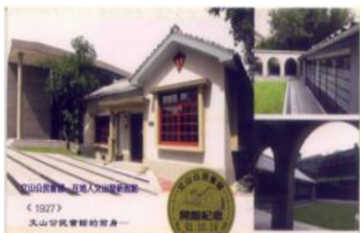
圖 3 整建後的文山公民會館