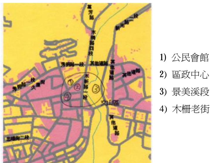
圖 4：文山工作坊規劃基地示意圖（註 18）

「文山工作坊」初始是以荒廢多年的木柵國小校長宿舍再現風華為主要規劃標的，漸而在國小當局對於校外使用該基地的排拒，以及老宿舍週邊可以說是綜融在地生活的代表性區塊，文山工作坊的「社區規劃」基地思考，也就延伸到會館周邊的木柵場景（圖 4）。