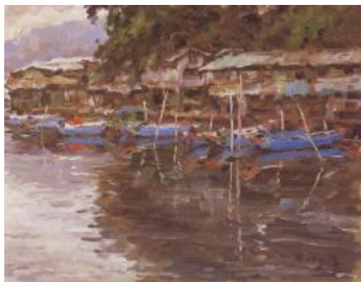
2002年 河 5F 油畫