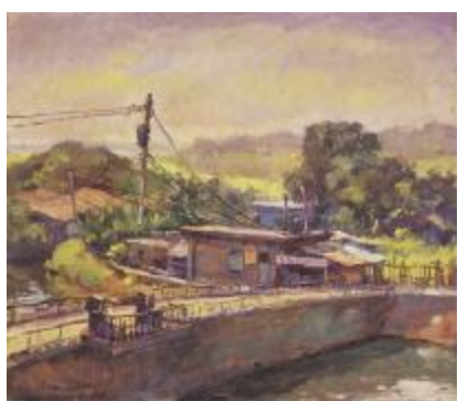
2002年 大溪 5F 油畫