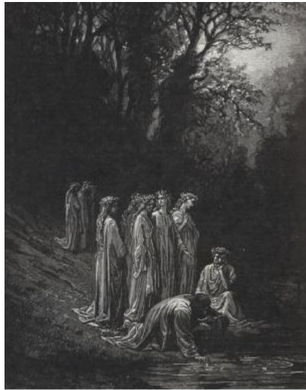
但丁飲忘川之水記起一切事