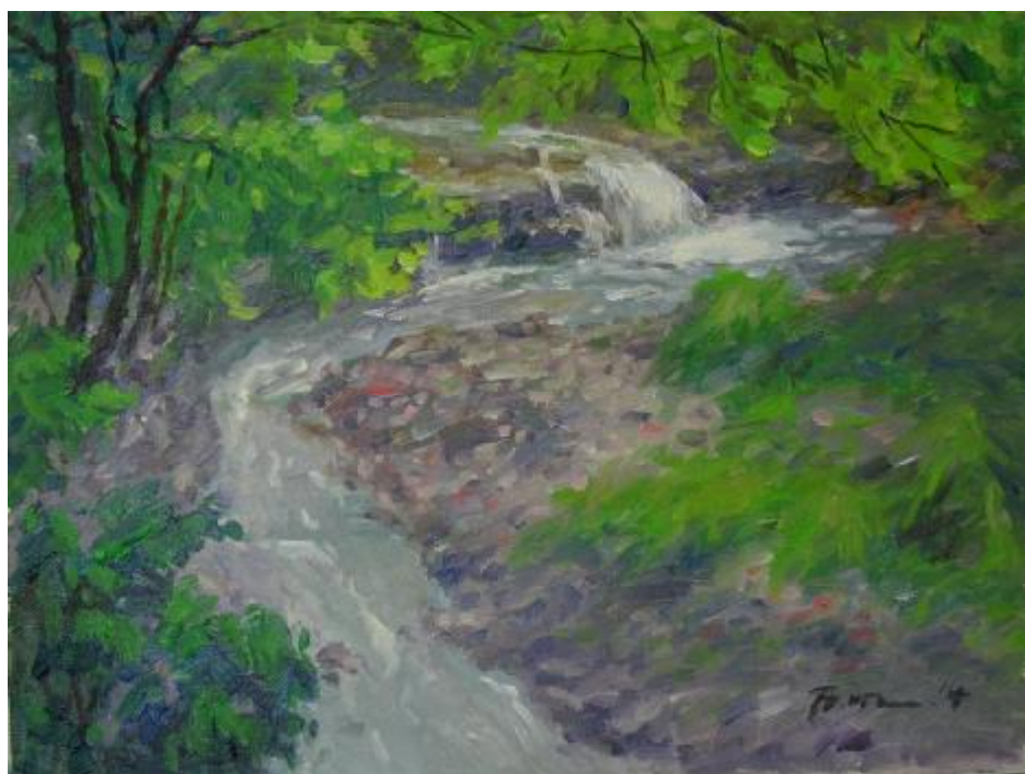
圖二十八 2004年 北投溪 5F 油畫