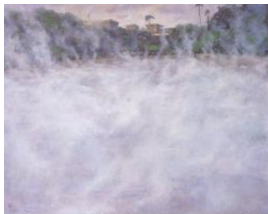
2002年 大溪之大-大溪 188F 油畫