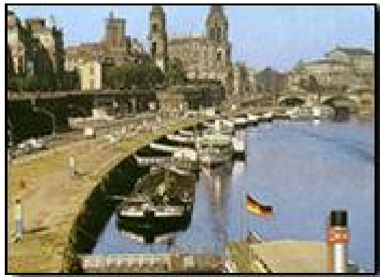
圖四、浪漫主義建築