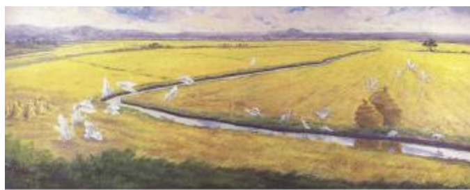
2002年 大溪 188F 油畫